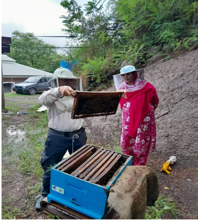
Hands-on Technical Training of Beekeeping