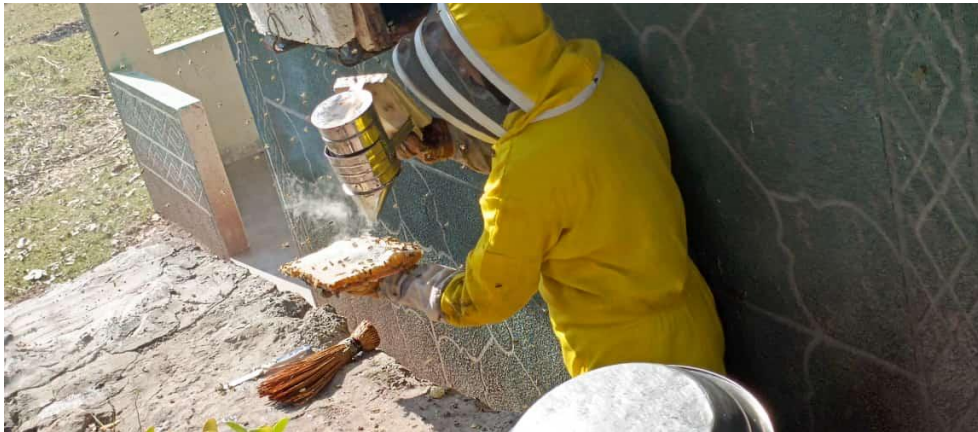
Honey Harvesting in Field