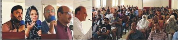
راولاکوٹ: جامد پوچھ راولاکوٹ شعبہ پلانٹ پتھالوجی کے ذریعہ ترقی و رکشاپ سے ماہرین خطاب کر رہے ہیں

راولاکوٹ (سٹاف رپورٹر) جامد پوچھ رکشاپ میں ملک بھر سے زرعی ماہرین، طلبہ و طالبات اور ترقی پسند زمینداروں کی کثیر تعداد نے شرکت کی۔ شرکاء نے زمین کی کفالت اور ترقی کے لیے زرعی ماہرین، طلبہ و طالبات اور ترقی پسند زمینداروں کی کثیر تعداد نے شرکت کی۔ شرکاء نے زمین کی کفالت اور ترقی کے لیے زرعی ماہرین، طلبہ و طالبات اور ترقی پسند زمینداروں کی کثیر تعداد نے شرکت کی۔